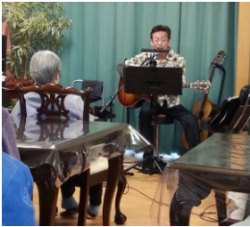
ひまわりの郷にて ギターと歌

寒さに閉ざされた冬も終わり、ホームでは楽しく活発な時間が増えてきました。利用者さまの笑顔に職員も癒されます。