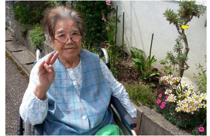
外の空気は やはり気持ちいいですね 思わずピース(^o^)